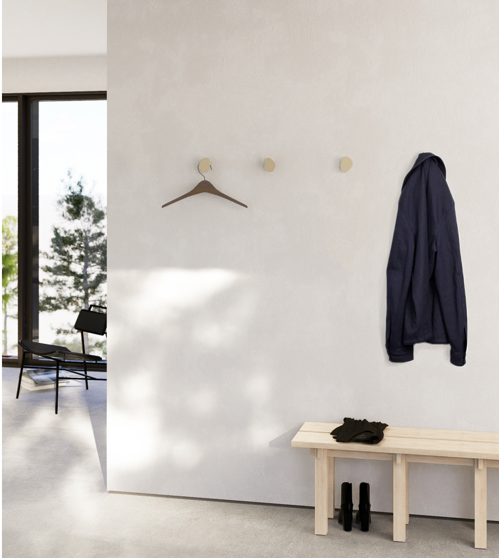
DOLI | Crochet par Appareil Atelier