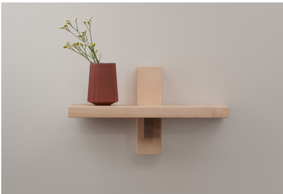
PILOTI | Petite tablette par Appareil Atelier