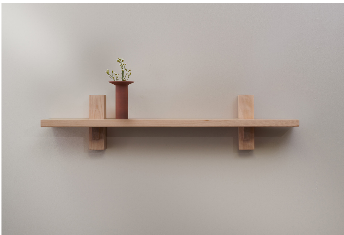
PILOTI | grande tablette par Appareil Atelier