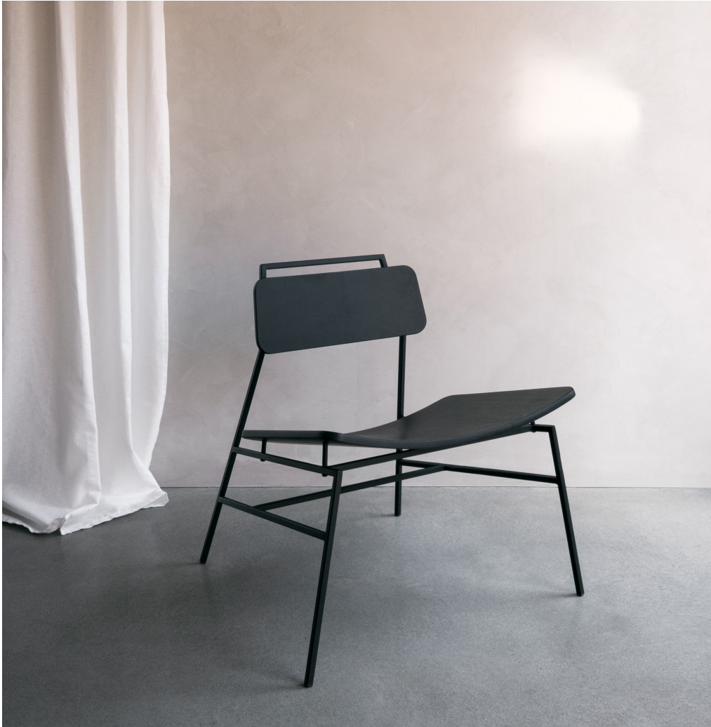
FLOE | chaise lounge par Appareil Atelier