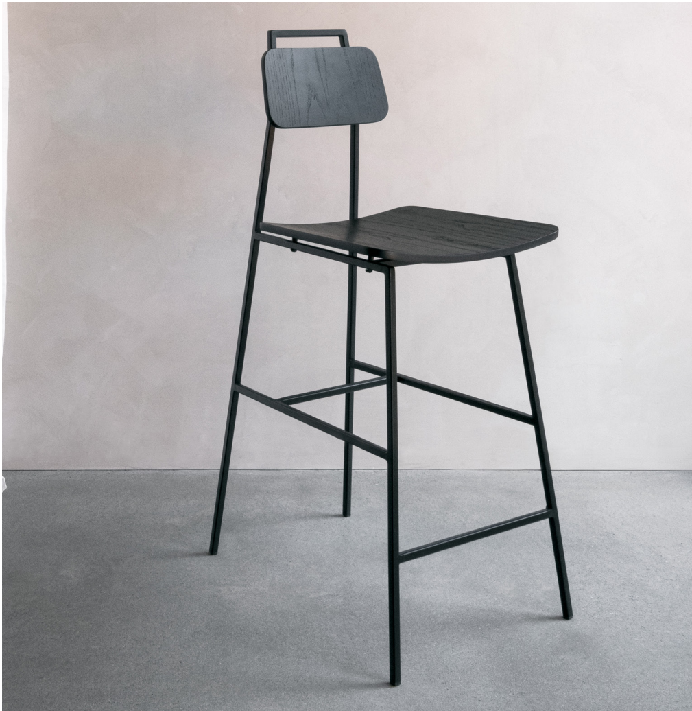
FLOE | chaise haute par Appareil Atelier